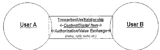
그림 2 Users들은 디지털 아이템 관련 특정한 거래 하에서 그들의 역할에 따라 정의되어진다.

MPEG-21 멀티미디어 프레임워크에서 User들은 그림 2와 같이 또 다른 User와의 어떤 상호관계에 의하여 그 identity가 규정되어 진다. 이러한 디지털 아이템에 관한 User들 간의 상호작용으로 콘텐츠의 생성, 공급, 전송, 거래, 저장, 소비 등의 활동(Action)이 형성된다.